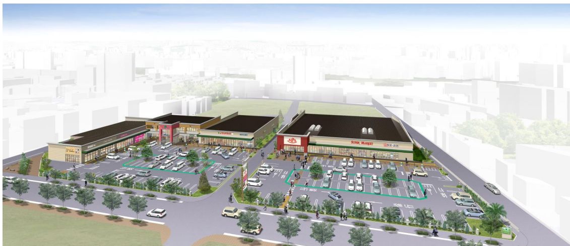
「フォレストモール八王子大和田」イメージ

弊社はアメリカ西海岸の商業施設をモデルとし、地域に根ざした近隣型ショッピングモールを開発・運営しております。当施設は、利用しやすい駐車場スペースの確保、統一感のある建物デザイン、憩いを感じられる植栽を備えた近隣住民の日常生活をより豊かにすることをモットーとした商業施設となっております。